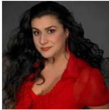
Чечилия Бартоли род. 1966 итальянская оперная певица