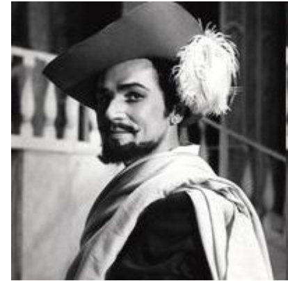
Георг Отс (1920-1975) эстонский оперный певец