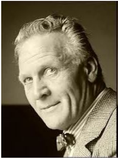
Фёдор Шаляпин (1873-1938) русский оперный певец