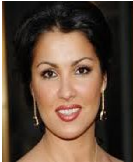
Анна Нетребко род.1942 – русская оперная певица