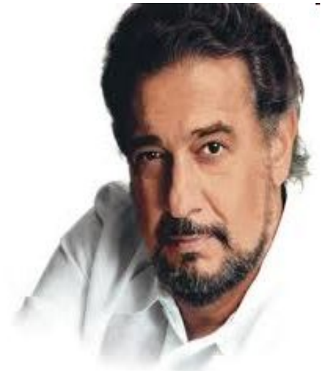
Пласидо Доминго род. 1941 испанский оперный певец