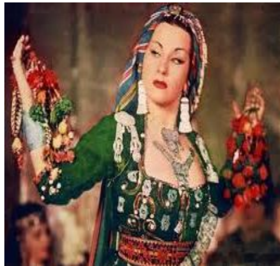
Yma Sumac (1922-2008) – перуанская оперная певица и актриса (5 октав)