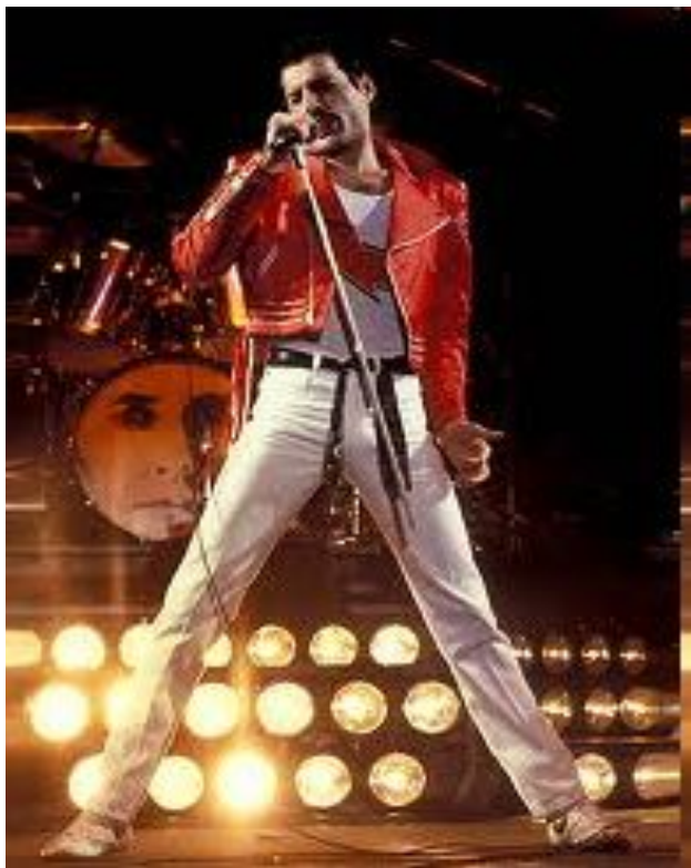
Freddie Mercury (1941-1996) британский рок-певец (3 октавы)