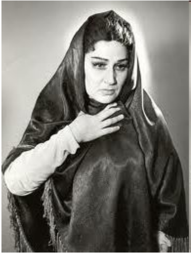
Ирина Архипова (1925 – 2010) русская оперная певица