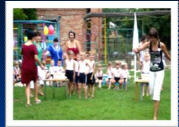
Участие в жизни ДОУ