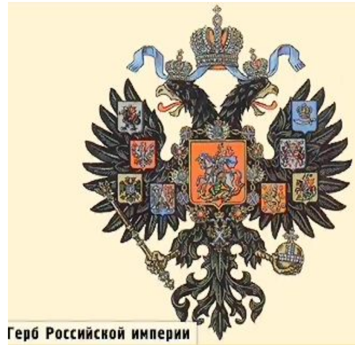
Герб Российской империи

По своему политическому устройству Россия была самодержавной монархией. Во главе государства стоял император (в просторечии его по традиции называли царем). В его руках была сосредоточена высшая законодательная и распорядительная власть. В России оставалось господство феодально-крепостнической системы и отсутствие конституции и выборного представительства.