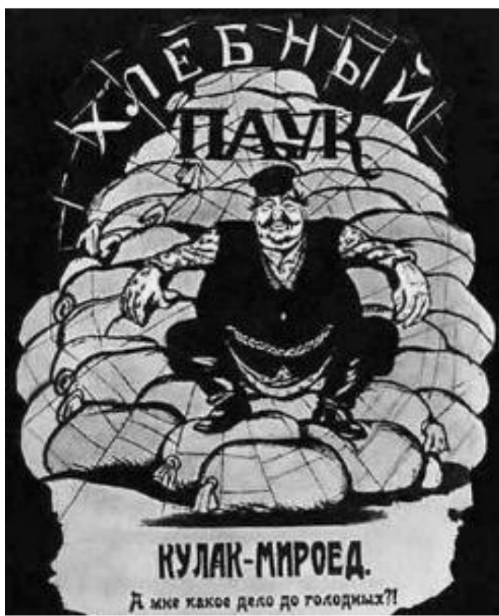
В.Дени. Хлебный паук.

В начале для получения продовольствия правительство использовало товарообмен, но в условиях развала экономики промышленных товаров не хватало и крестьяне не спешили отдавать хлеб государству в обмен на реквизиционные чеки. Над страной нависла угроза голода. В столицах выдавали по 50-100 г хлеба в сутки на человека. 13 мая ВЦИК установил душевые нормы потребления хлеба для крестьян. Весь хлеб сверх установленной нормы подлежал конфискации.