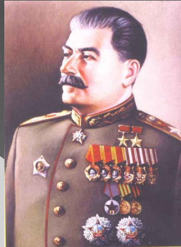
Сталин Иосиф Виссарионович (1879 - 1953)