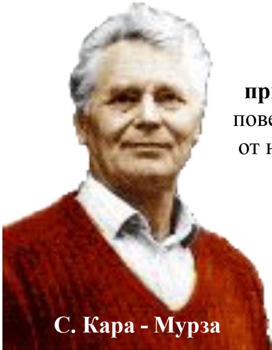
С. Кара - Мурза

С. Кара - Мурза считает, что " манипуляция - это "вид применения власти" , при котором обладающий ею влияет на поведение других, не раскрывая характер поведения, которое он от них ожидает". Он выделяет три главных, родовых признаков манипуляции.