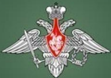
Министерство обороны Российской Федерации

отнесение их к компетенции пограничных представителей Российской Федерации, федерального органа исполнительной власти, уполномоченного в области обороны, или федерального органа исполнительной власти, уполномоченного в области иностранных дел, определяются договорами РФ с сопредельными государствами о Государственной границе и ее режиме, иными международными договорами РФ, федеральными законами, решениями Правительства РФ.