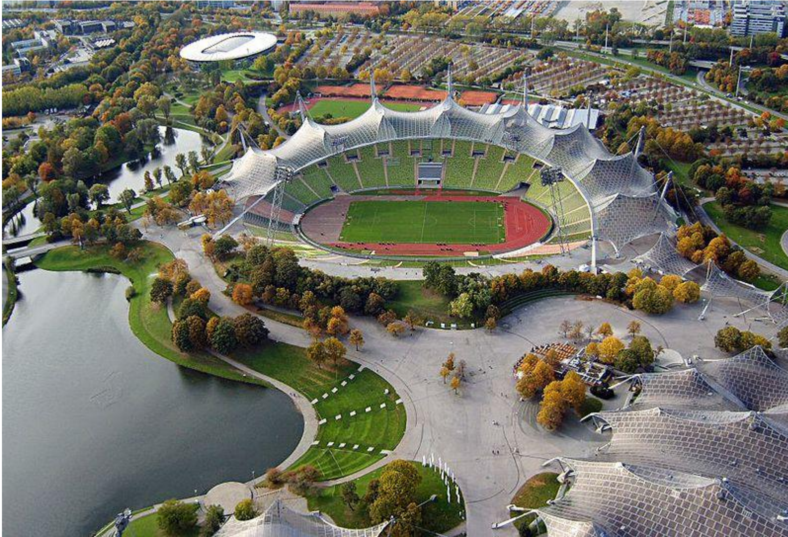
Olimpiashtadion - Mehrzweck-Stadion in München. Gelegen im Herzen des Olympiaparks München