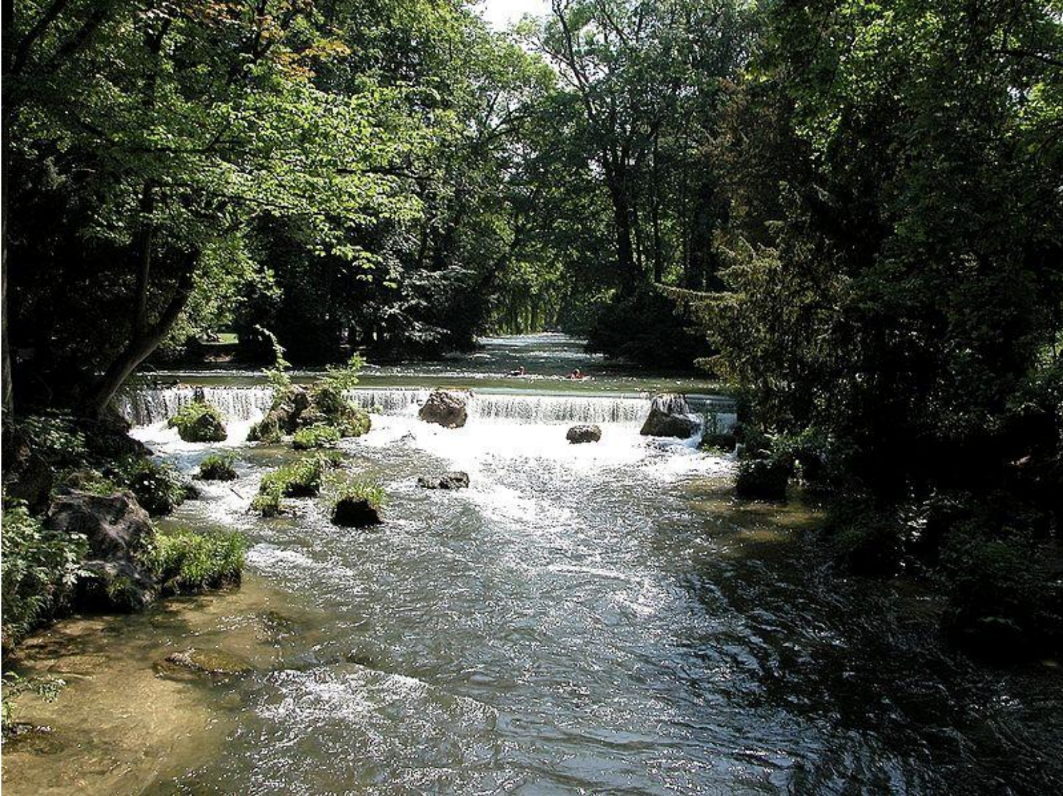
Englisch Garten in München - einer der größten Stadtparks der Welt.