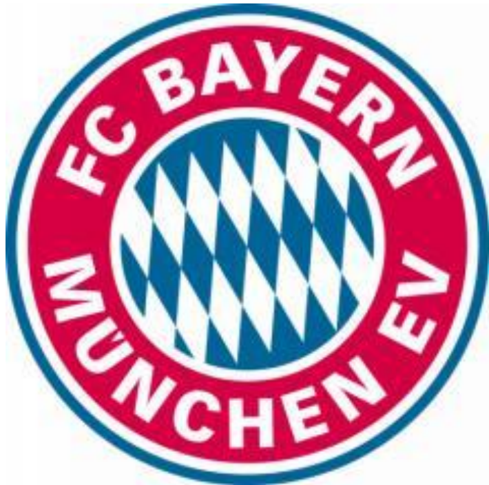
FC Bayern München