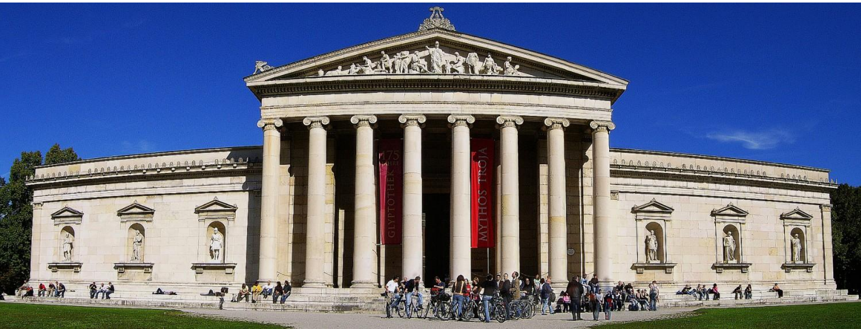
Glyptothek am koenigsplatz