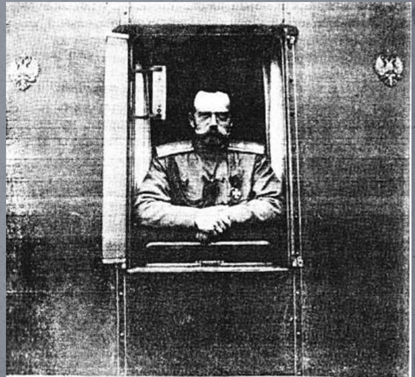
Государь Императоръ Николай II послѣ отреченія.