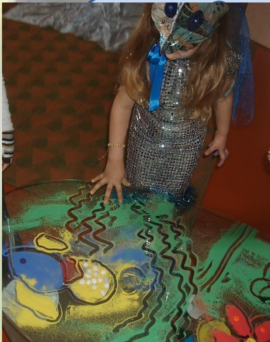
РИСОВАНИЕ ЦВЕТНЫМ ПЕСКОМ