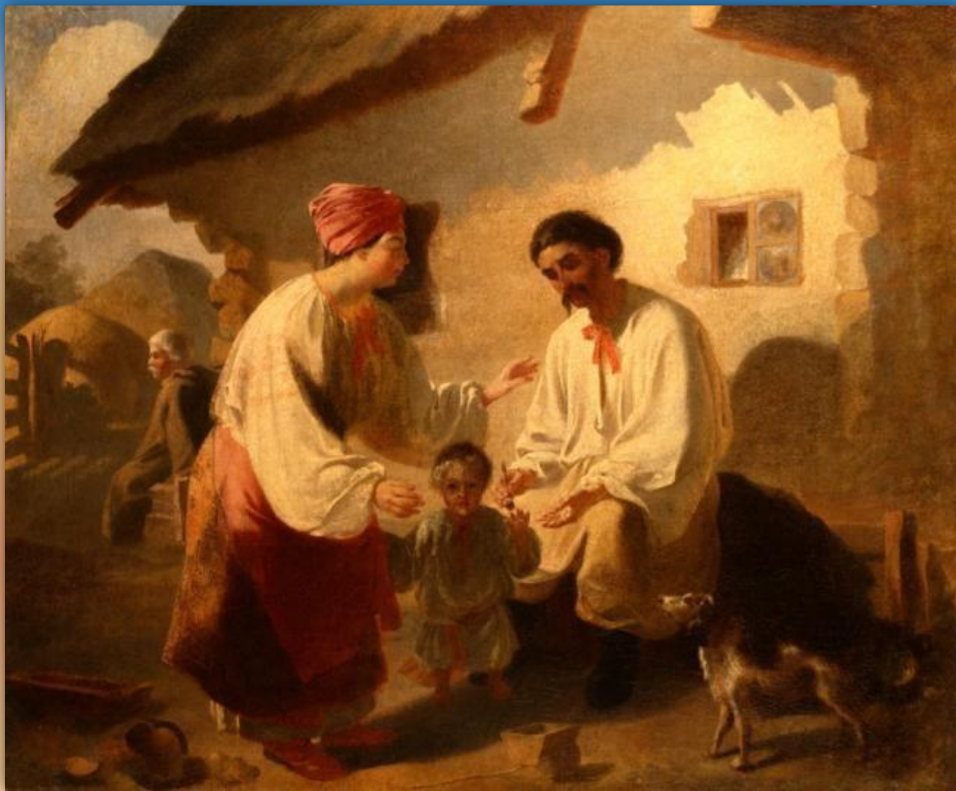
Тарас Шевченко “Селянська родина”