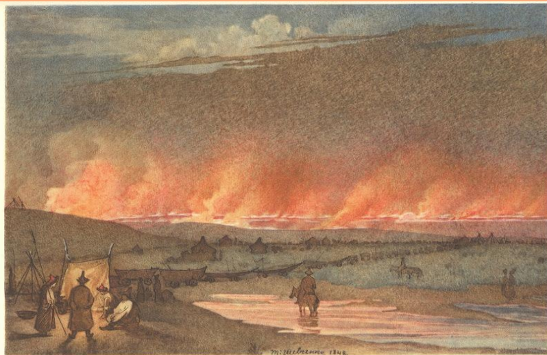
2. ПОЖЕЖА В СТЕПУ. Акварель. [Ш. р. 12У] 1848.