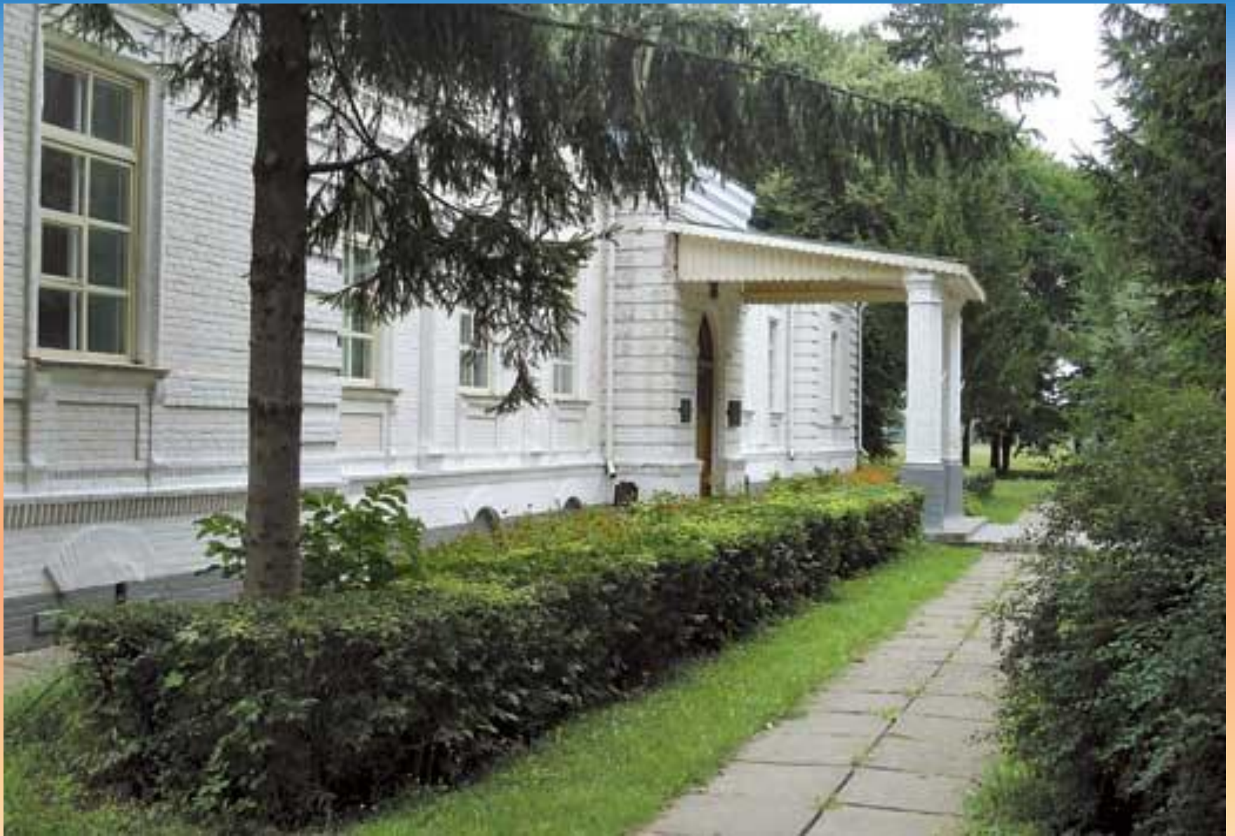
Хата дядка Петра Богорського