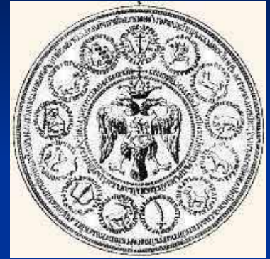
Печать Ивана Грозного