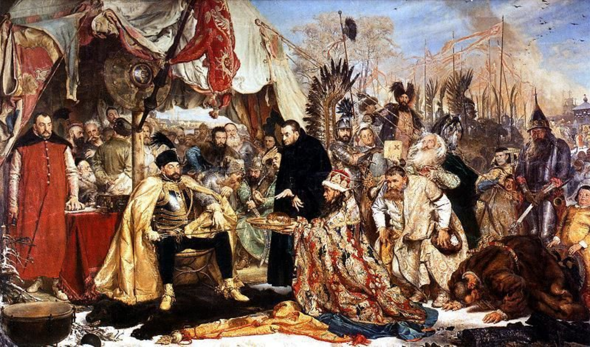
Ян Матейко. «Стефан Баторий под Псковом».