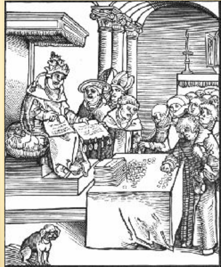
Pope Selling Sinful Indulgences

□ В католицизме существует учение об индульгенциях . В современном православии отсутствует подобная практика, хотя ранее «разрешительные грамоты», аналог индульгенций в православии существовали в Константинопольской православной церкви;