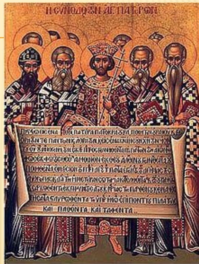
Отцы Первого вселенского собора с текстом Символа Веры

□ И Православная и Католические церкви почитают только себя «единой святой, кафолической (соборной) и апостольской Церковью» (Никео-Цареградский символ веры).