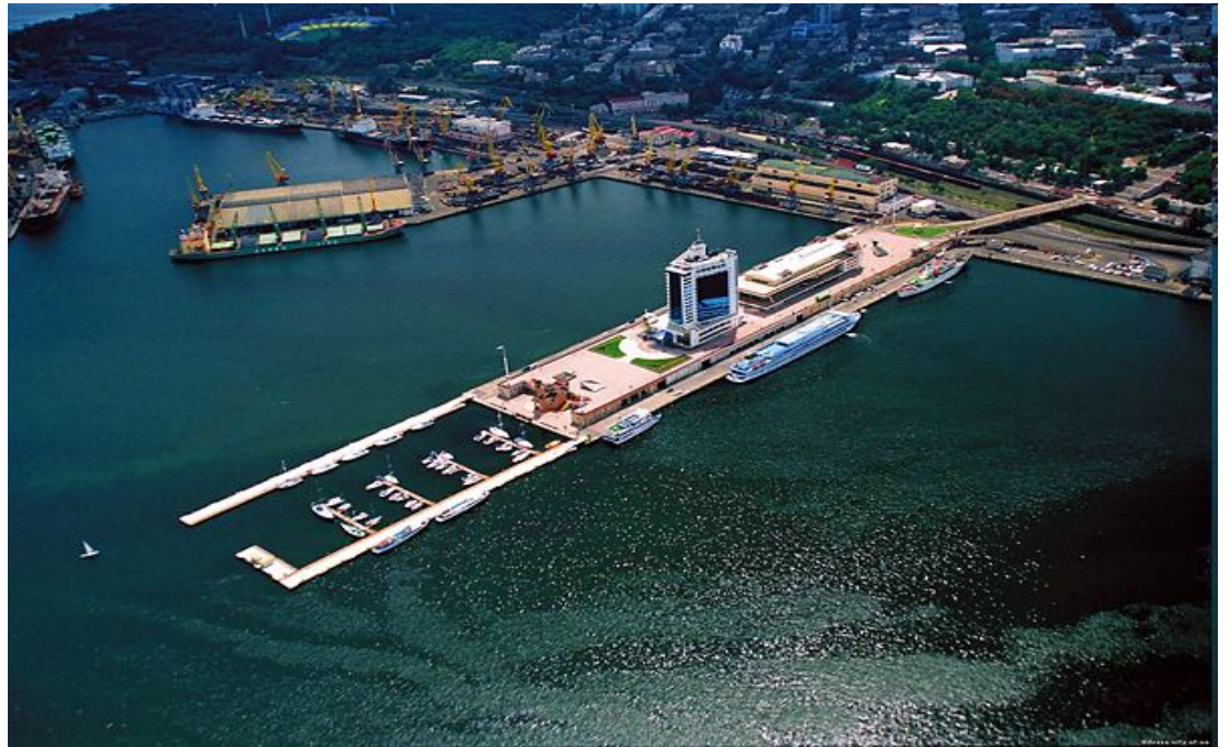
Одесский морской порт.

Территориальные возможности для развития портов весьма ограничены, поскольку абсолютное их большинство располагается в пределах населенных пунктов и городов.