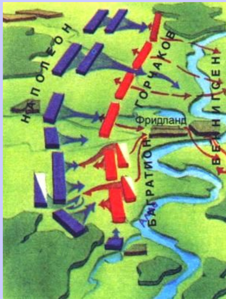
Битва под Фридландом

В 1806г. Возникла 4-я коалиция-Россия, Англия, Швеция, Пруссия.