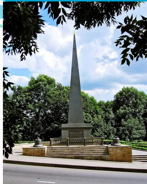
Обелиск Петру I в Липецке.

Наиболее долговечным осталось культурное наследие Петра I, сохранились многие учреждения культуры, памятники искусства и архитектуры, которыми страна гордится и сегодня.