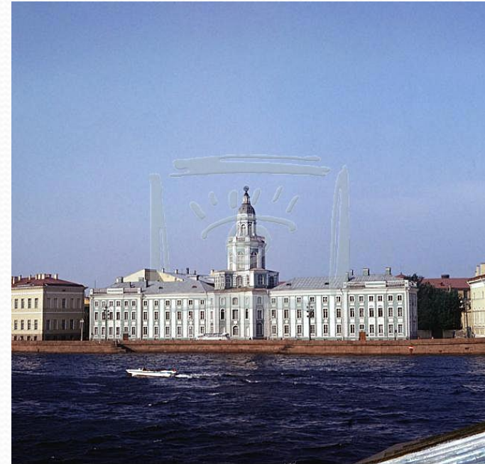
WWW.FOTOBANK.COM F802-7301 Fotobank Санкт-Петербург. Кунсткамера или Музей антропологии и этнографии имени Петра Великого РАН, ранее Институт этнографии академии наук СССР.