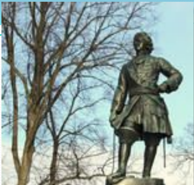
Памятник Петру I в Петровском сквере в Воронеже.