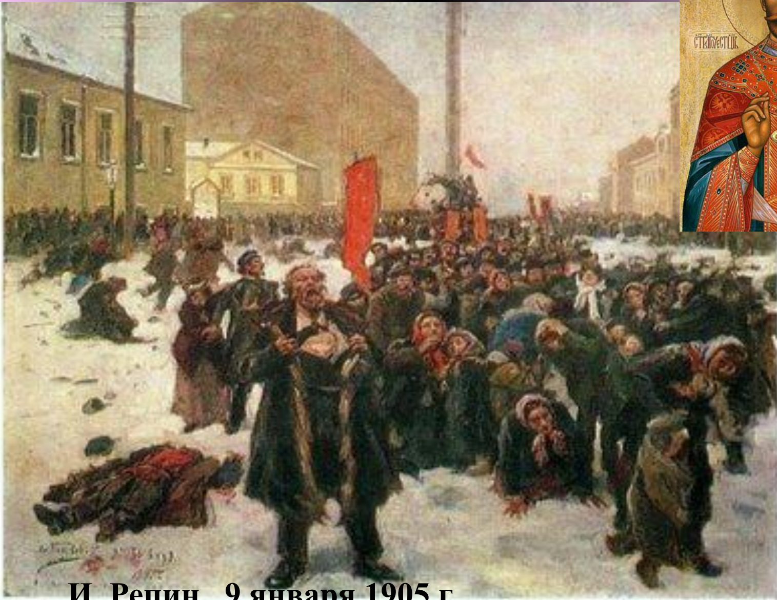
И. Репин 9 января 1905 г.

За это проклинают навеки, а не возводят в святые!