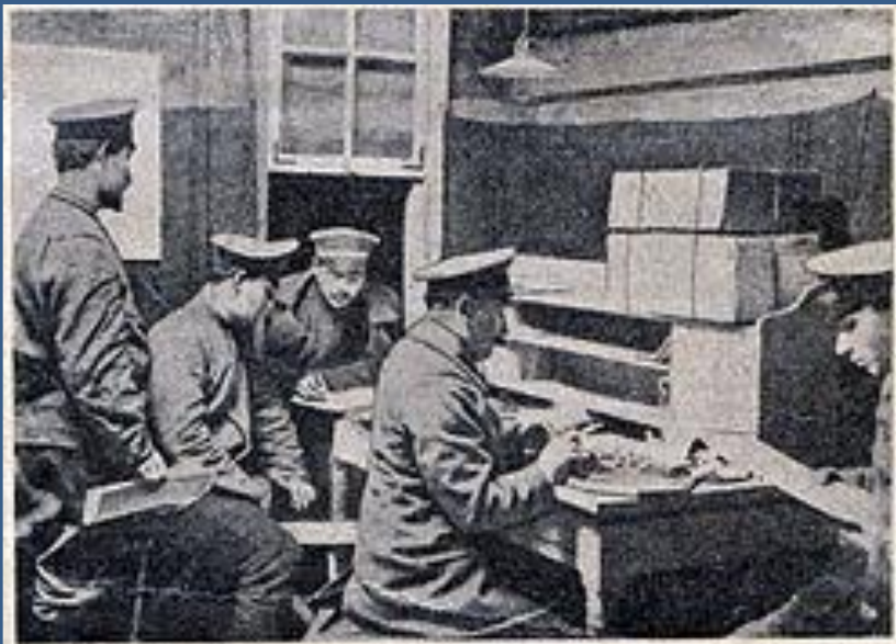
Просмотр корреспонденции с театра войны военной цензурой.