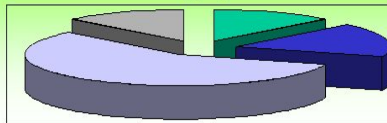
СХЕМА – это изложение, описание, изображение чего-нибудь в главных чертах. Выполняется без соблюдения масштаба с помощью условных обозначений в виде прямоугольников или иных геометрических фигур с простыми связями-линиями.