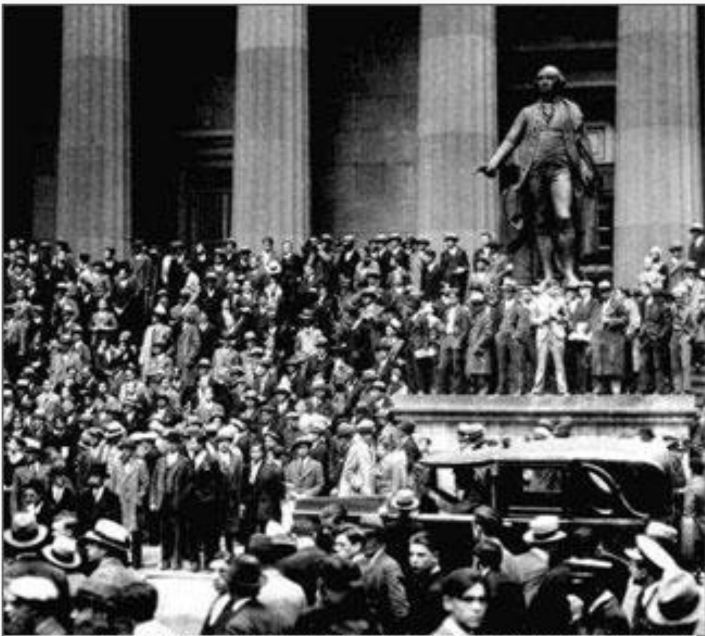
Перед зданием Нью-Йоркской фондовой биржи в "черный вторник" 29 октября 1929 года