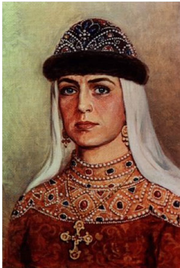
Вдова ИГОРЯ КНЯГИНЯ ОЛЬГА (945-957)