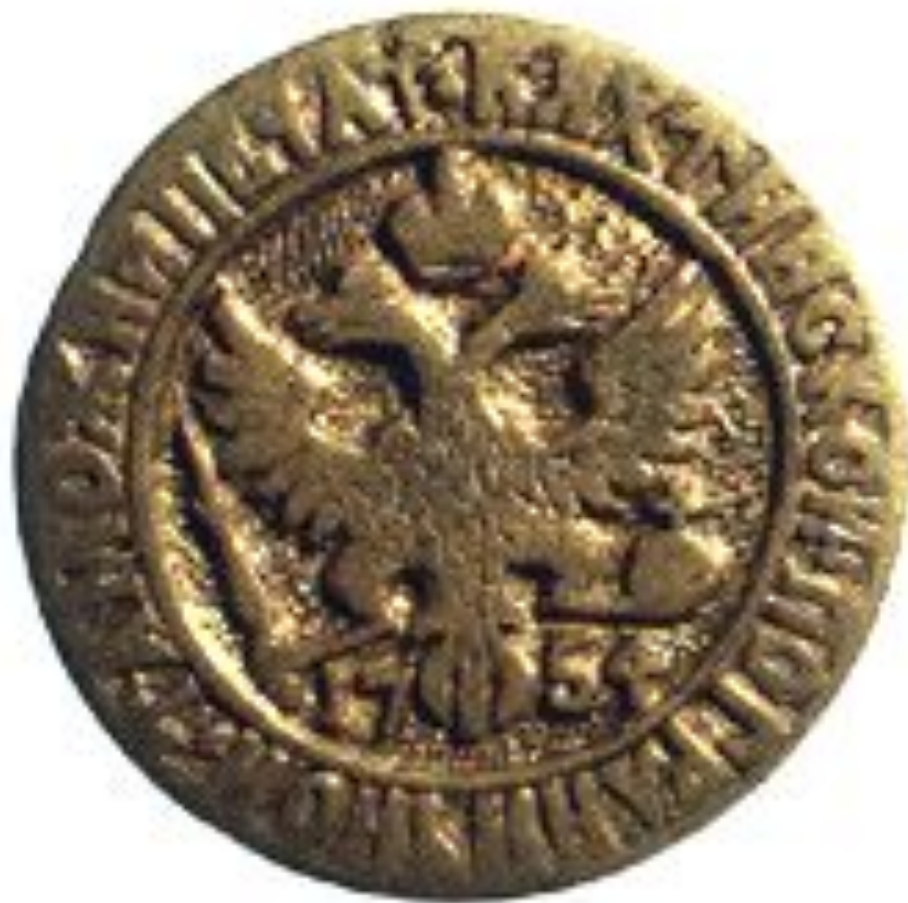
Печать пограничной таможни XVII в.

• В уездах существовали таможенные избы, на торговых путях имелись таможенные заставы.