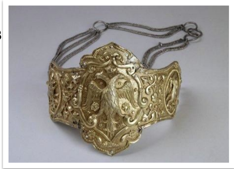
Решма. Мастерские Конюшенного приказа. XVII в