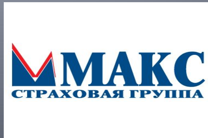
ЗАО «Страховая компания МАКС»