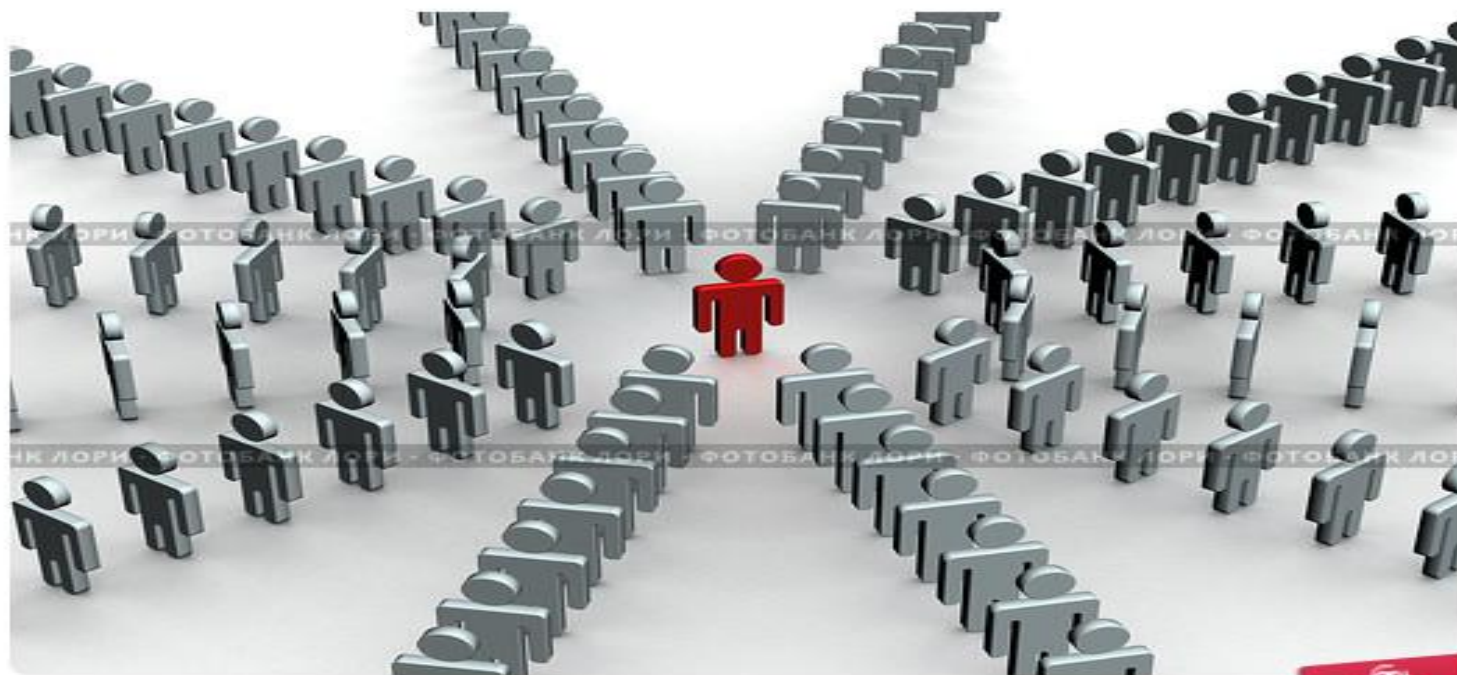
Концепция командной работы