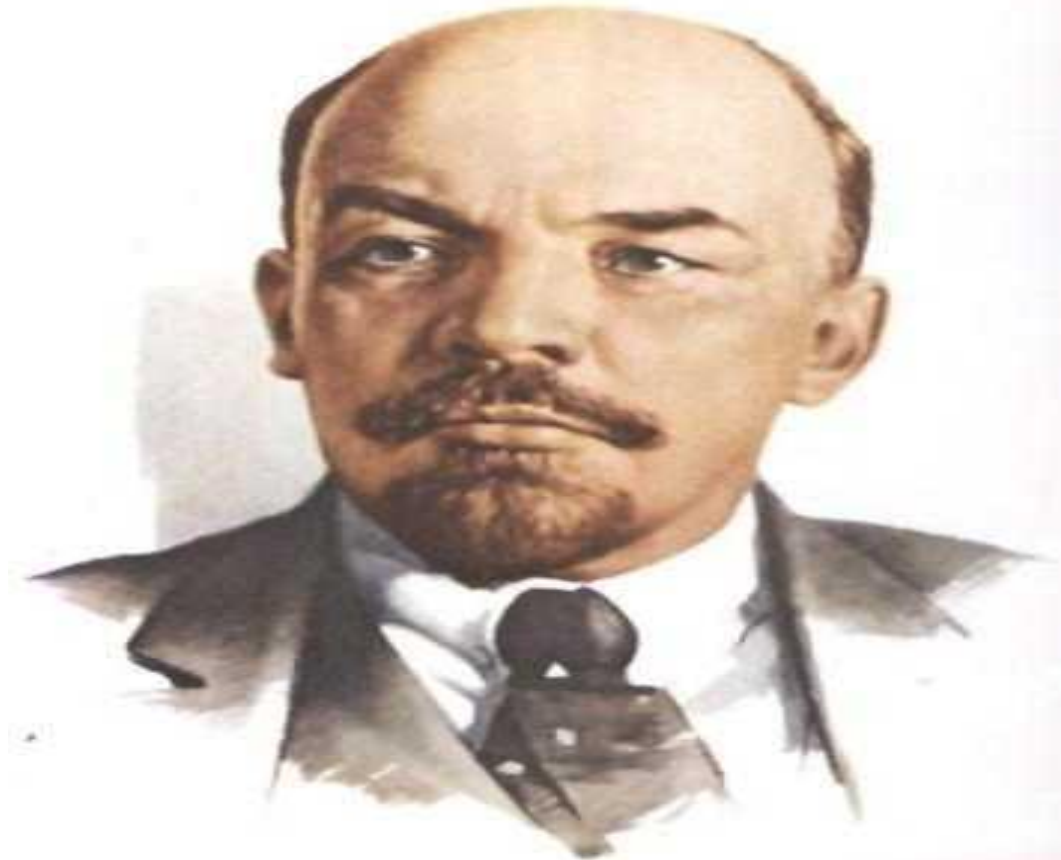
В. И. Ленин (1870-1924)

□ После 1917 г. ведущее место в духовной жизни общества занял ленинизм, постепенно превратившийся в государственную идеологию.