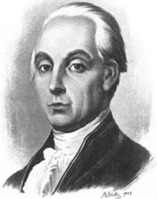
Александр Николаевич РАДИЩЕВ (1749—1802)