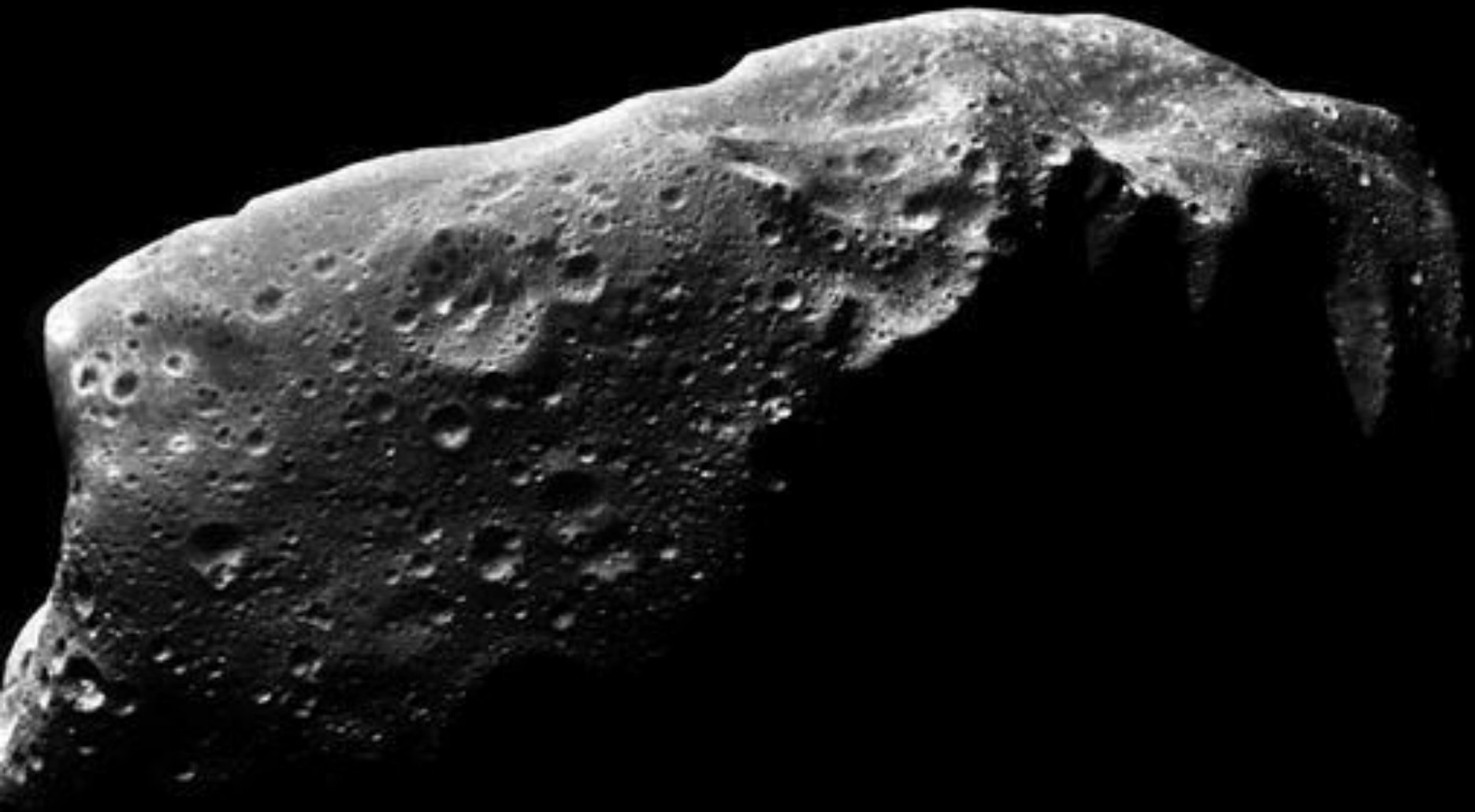
Астероид 243 Ида (изображение АМС "Галилео")