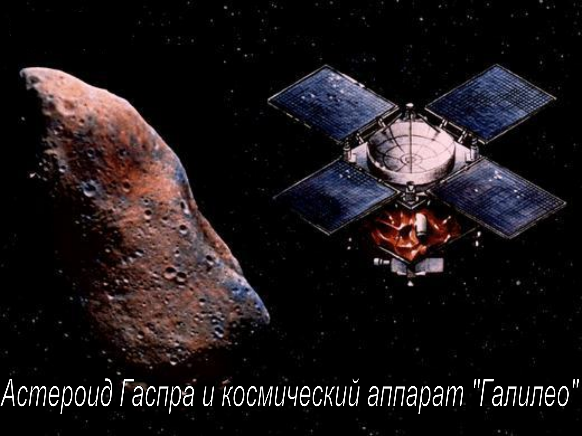
Астероид Гаспра и космический аппарат "Галилео"