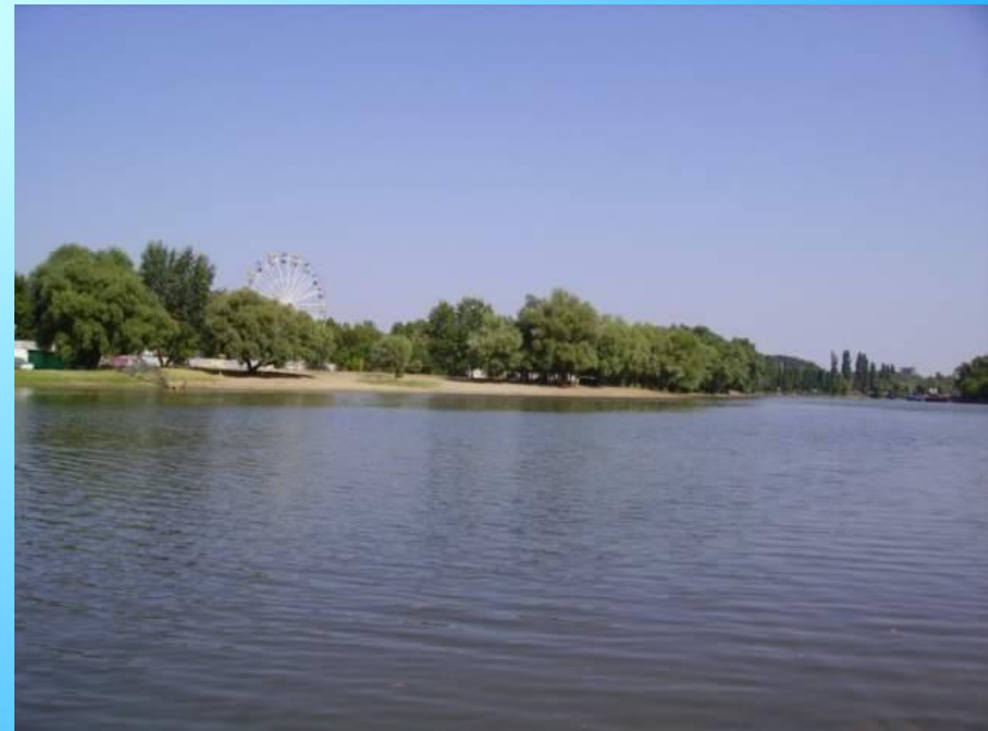
Кубань в нижнем течении