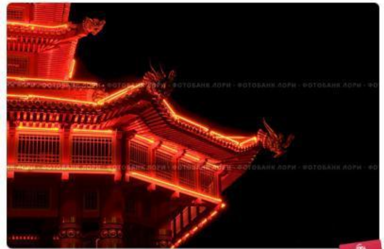
Элиста, Калмыкия. Фрагмент "Пагоды Семи Дней" с ночной подсветкой