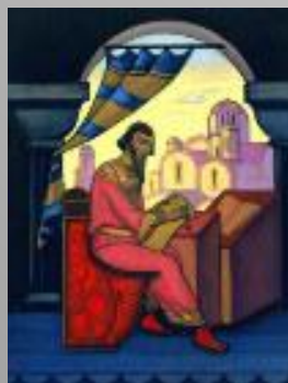
Ярослав Мудрый (Н. К. Рерих)