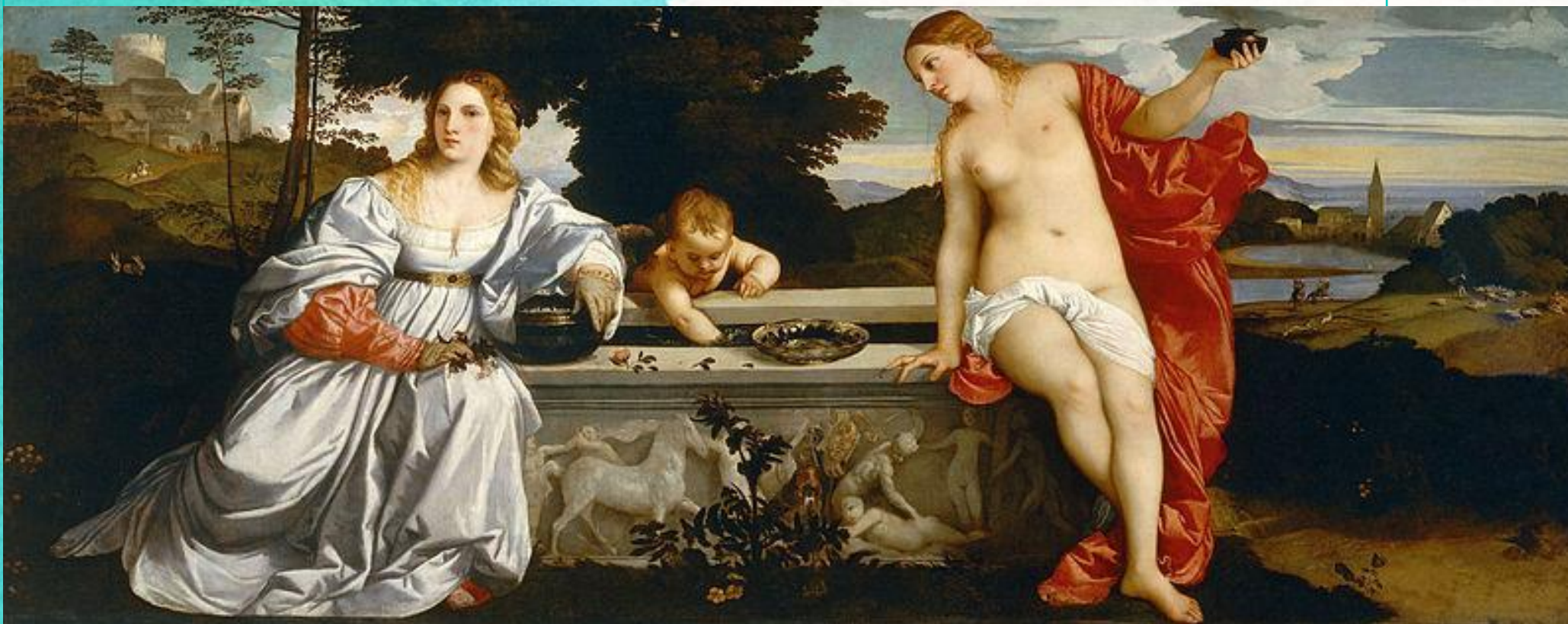
Любовь земная и Любовь небесная, 1514 Галерея Боргезе, Рим

Тициан пишет много мадонн и женских портретов. «Его образы в этот период спокойны и радостны, отмечены жизненным полнокровием, яркостью чувств, печатью внутренней просветлённости. Мажорный колорит построен на созвучии глубоких, чистых красок.» Наиболее известными картинами этого периода являются «Цыганская мадонна» (около 1511), а также «Любовь земная и Любовь небесная» (1514) – картина, написанная по заказу Николо Аурелио, члена Совета десяти, и «Женщина с зеркалом» (около 1514)