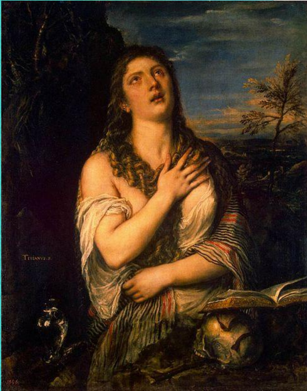
Кающаяся Мария Магдалина, 1560-е

Он создаёт замечательные женские образы в «Кающейся Магдалине» (около 1533), «Венере Урбинской» (до 1538).