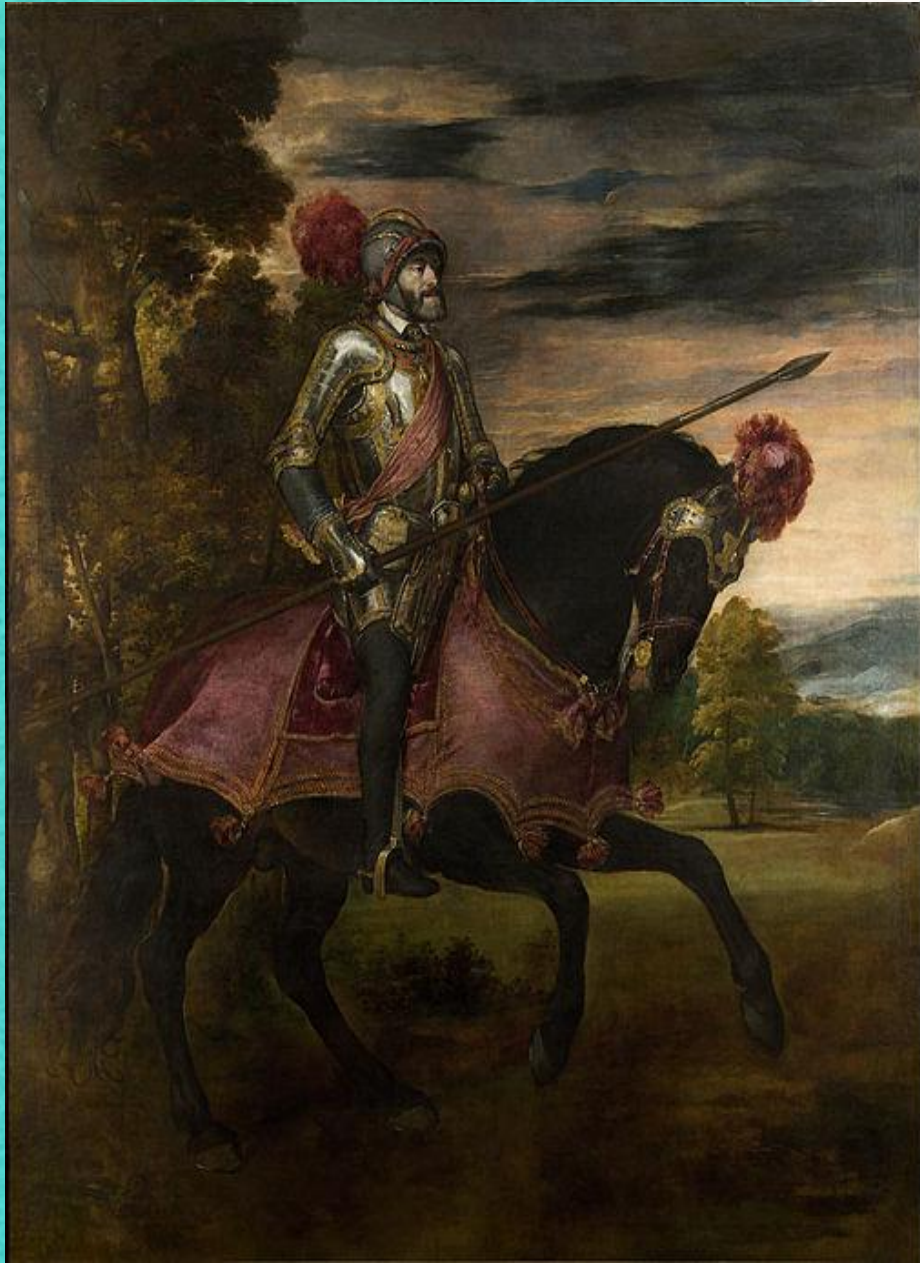
Конный портрет Карла V, 1548

Конец 1530-х—1540-е гг. — время расцвета портретного искусства Тициана. С удивительной прозорливостью изображал художник современников, запечатлевая самые различные, порой противоречивые черты их характеров: уверенность в себе, гордость и достоинство, подозрительность, лицемерие, лживость и т.д. Наряду с одиночными он создавал и групповые портреты, беспощадно вскрывая скрытую сущность взаимоотношений изображенных, драматизм ситуации. С редким искусством Тициан находил для каждого портрета наилучшее композиционное решение, выбирал характерные для модели позу, выражение лица, движение, жест.