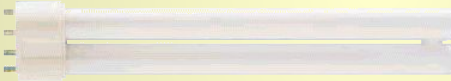
Лампа дневного света

Под действием падающего излучения, атомы вещества возбуждаются и после этого тела высвечиваются.