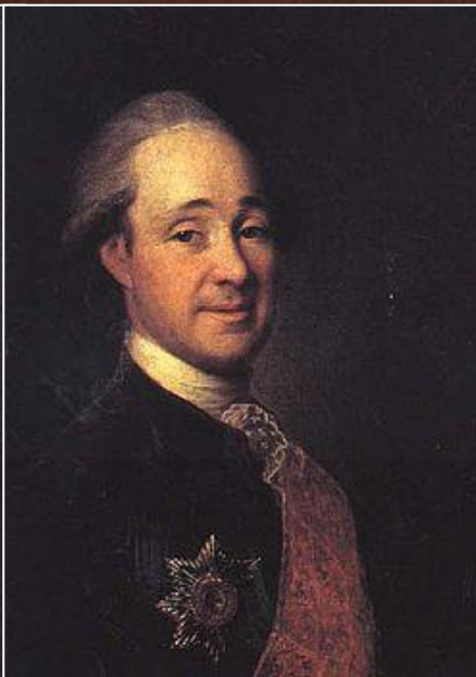
А. Н. Радищев М. М. Щербатов