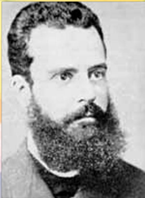
итальянского социолога Вильфредо Парето (1848 - 1923 гг.)