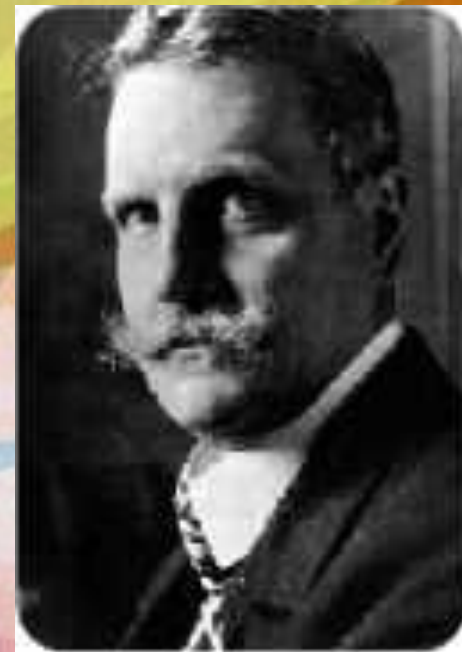
немецкого политолога Роберта Михельса (1876 - 1936 гг.)