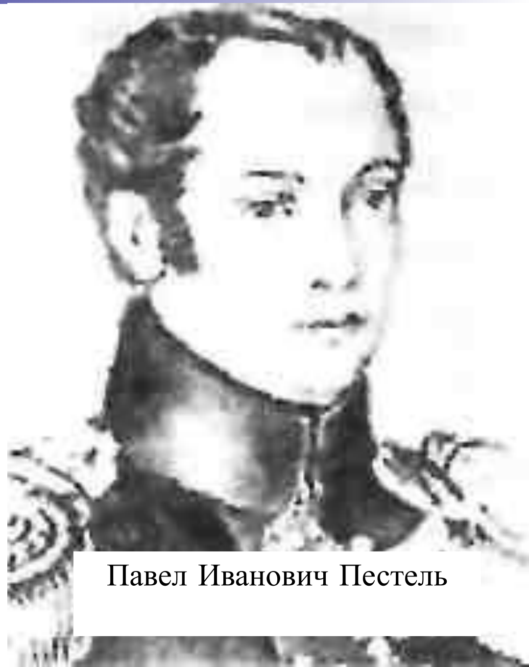
Павел Иванович Пестель