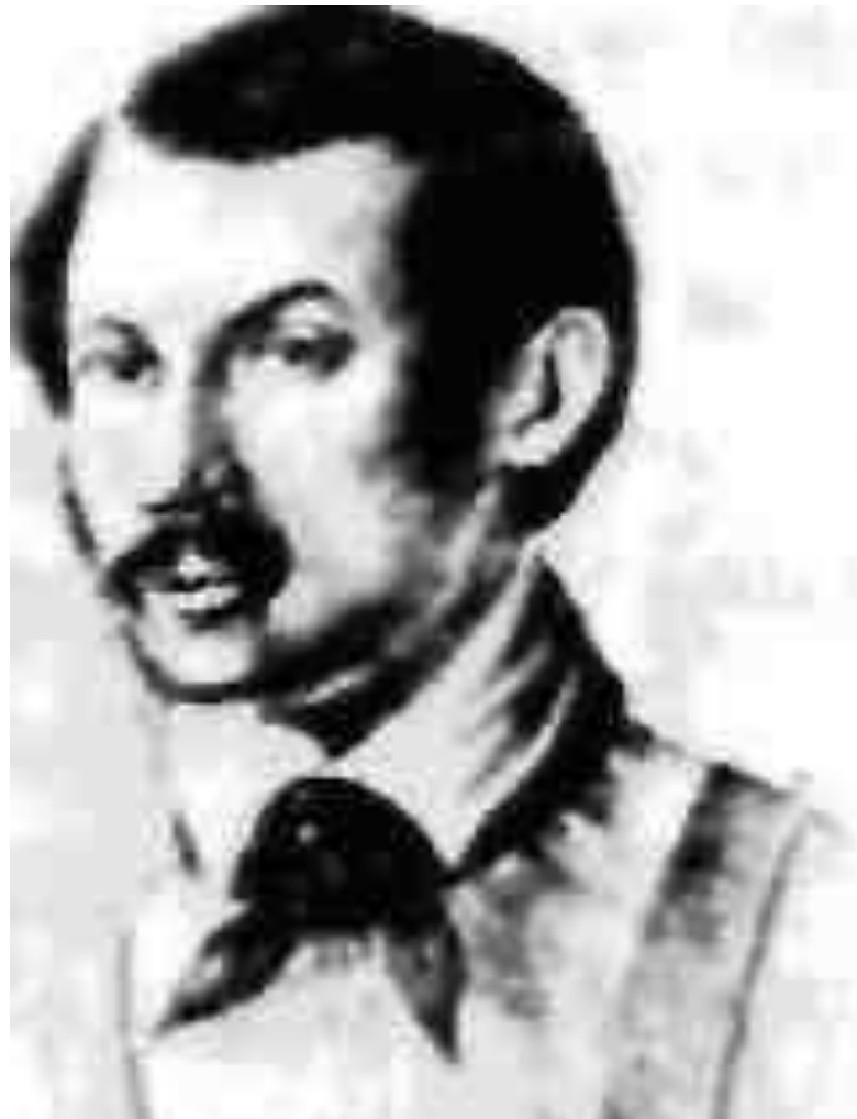
Александр Александрович Бестужев