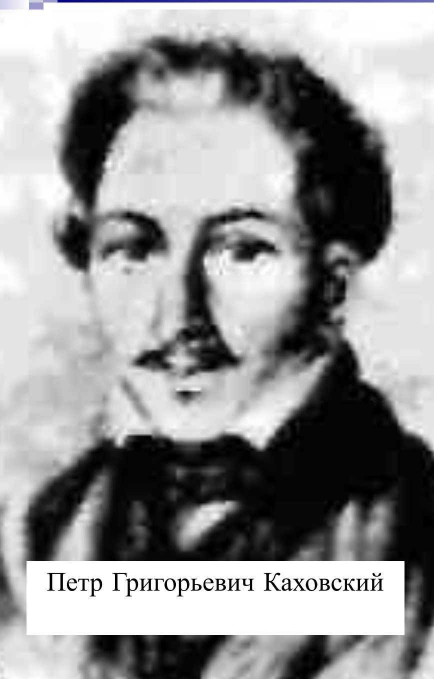
Петр Григорьевич Каховский