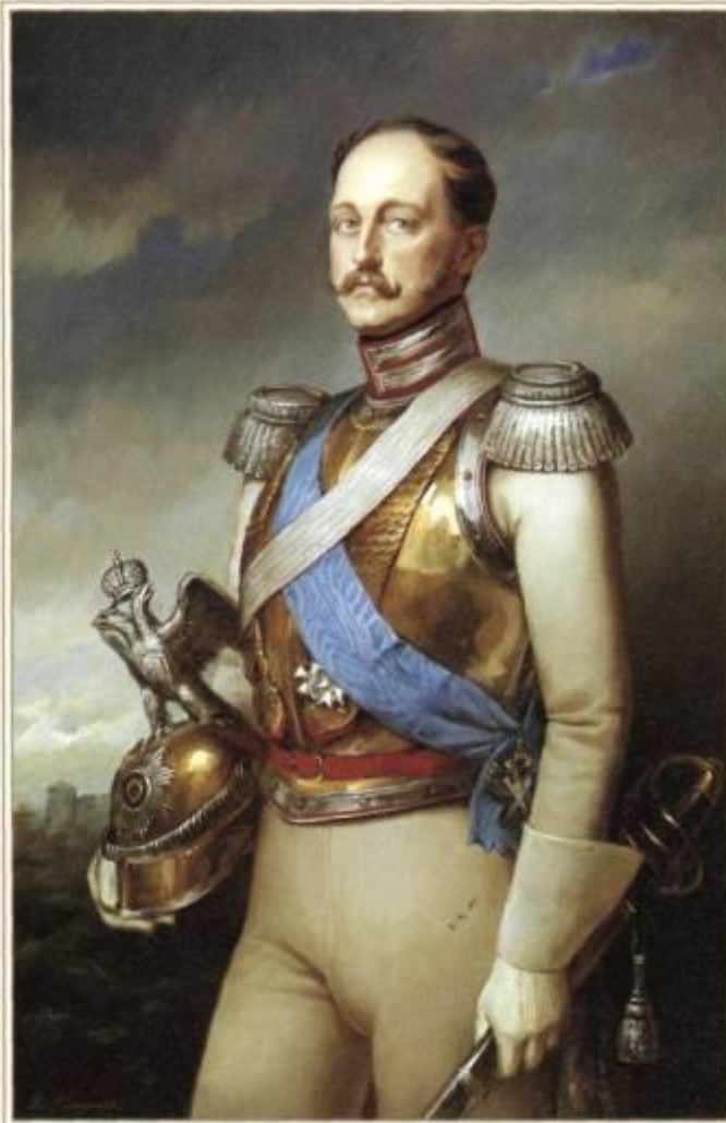
А. Свешников. Портрет императора Николая I