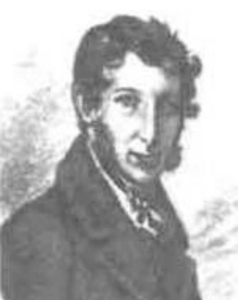
Князь Сергей Петрович Трубецкой