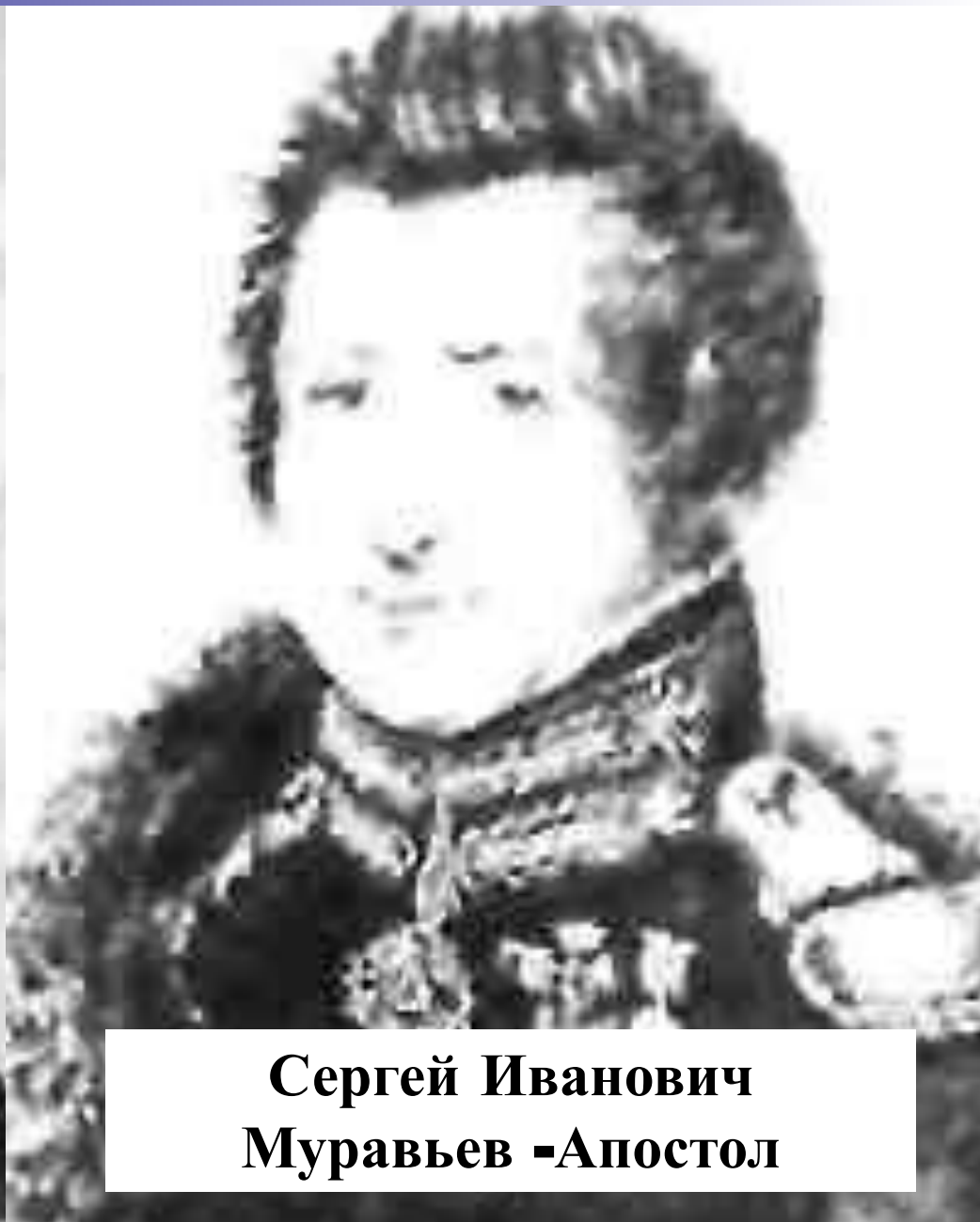
Сергей Иванович Муравьев -Апостол