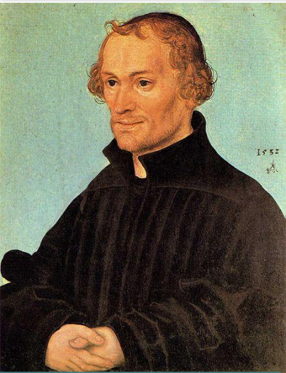
Фи́лип Мела́нхтон (нем. Philipp Melancthon ; 16 февраля 1497, Бреттен ) - немецкий гуманист, теолог и педагог.