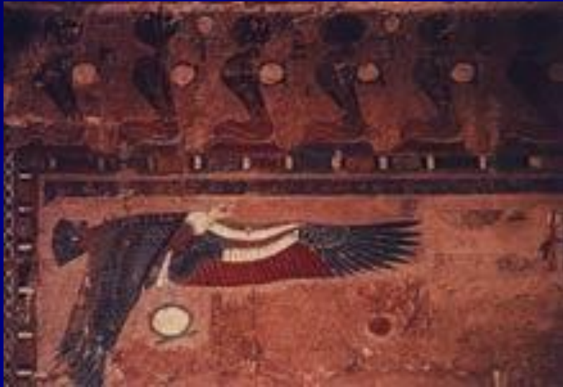
Богиня Нехбет Фреска из храма царицы Хатшепсут XV в. до н.э.