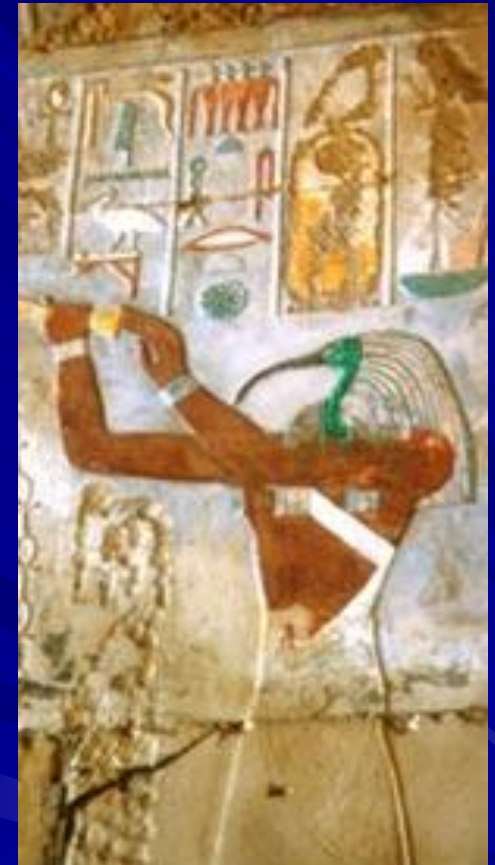
Бог Тот Барельеф гробницы Хоремхеба

Изображался в образе священной птицы ибиса или человеческой фигурой с головой ибиса