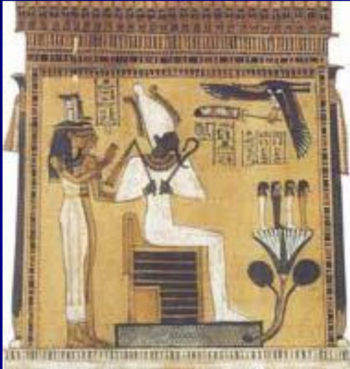
Бог Осирис Роспись, VIII в. до н. э