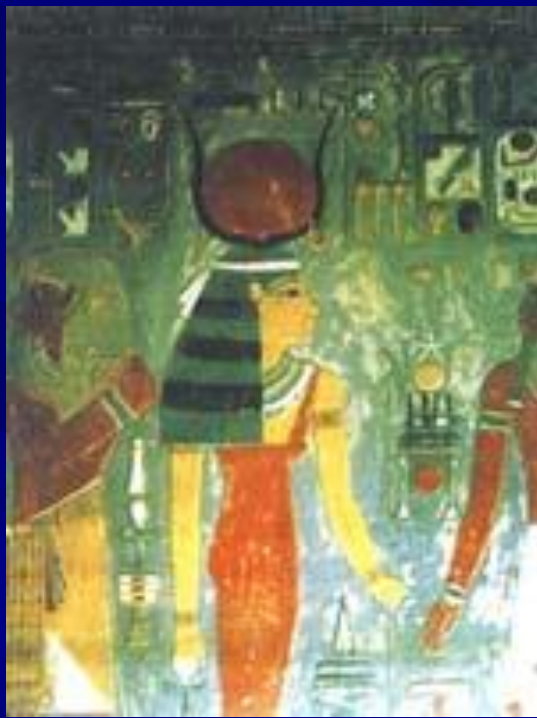
Богиня Хатхор Роспись из храма Хоремхеба

Хатхор, Хатор ("дом Гора", т. е. "небо")