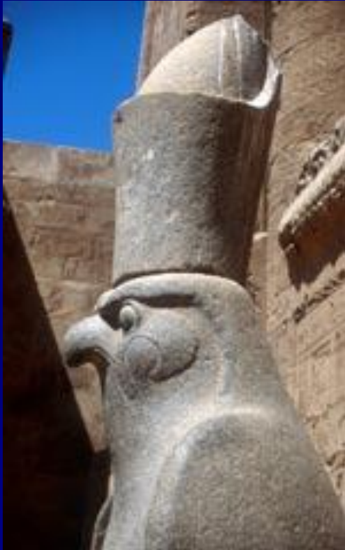
Статуя Гора 1290г. до н.э