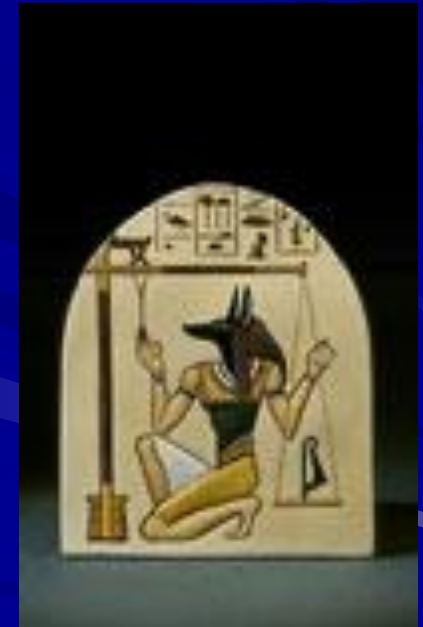
Анубис извлекает сердце умершего, чтобы взвесить его на суде Осириса