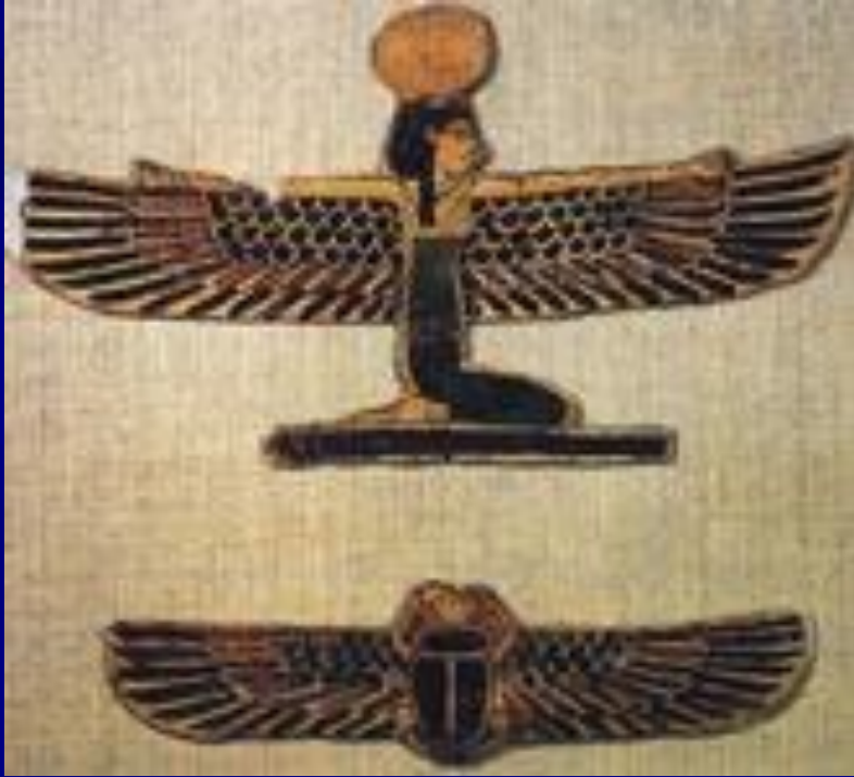
Богиня Нут и скарабей Амулеты периода династии Птолемеев, I в. до н.э.