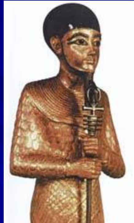
Бог Птах Статуя из сокровищницы Тутанхамона XIV в. до н. э.