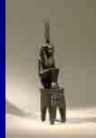
МААТ XX династия бронза, Берлинский музей