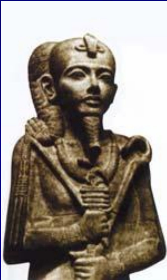
Бог Хонсу, гранит Ок. 1350 г. до н. э.