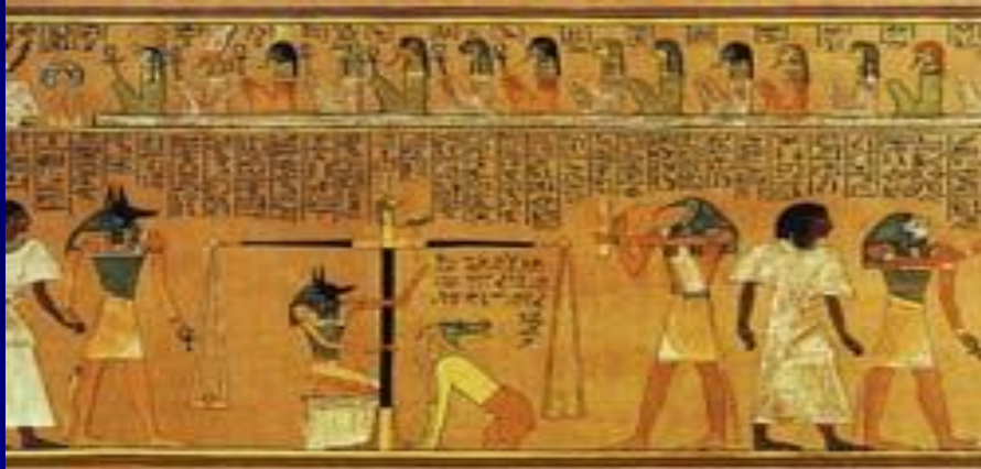
Суд Осириса «Книга мертвых»

Идеалом высшей мудрости и правды, олицетворением лучших сторон человеческой природы, воплощением ума у египтян являлся бог Тот