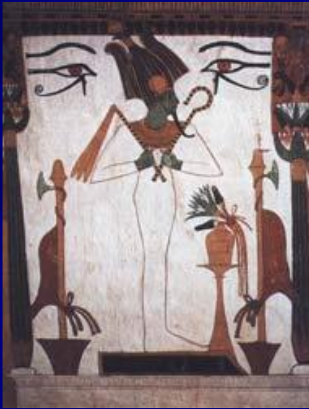
Осирис Роспись из гробницы Сеннеджема Фрагмент, XIII в. до н. э.