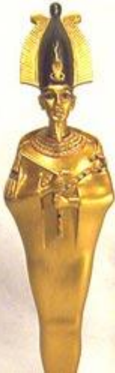
Статуя бога Осириса Новое Царство