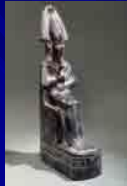
Осирис VI в. до н.э. базальт Москва, ГМИИ им. А.С. Пушкина

Осирис научил египтян земледелию, виноградарству и виноделию, добыче и обработке медной и золотой руды, врачебному искусству, строительству городов, учредил культ богов