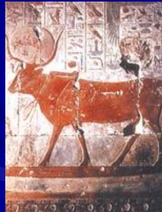
Богиня Хатхор Роспись из храма Хатшепсут