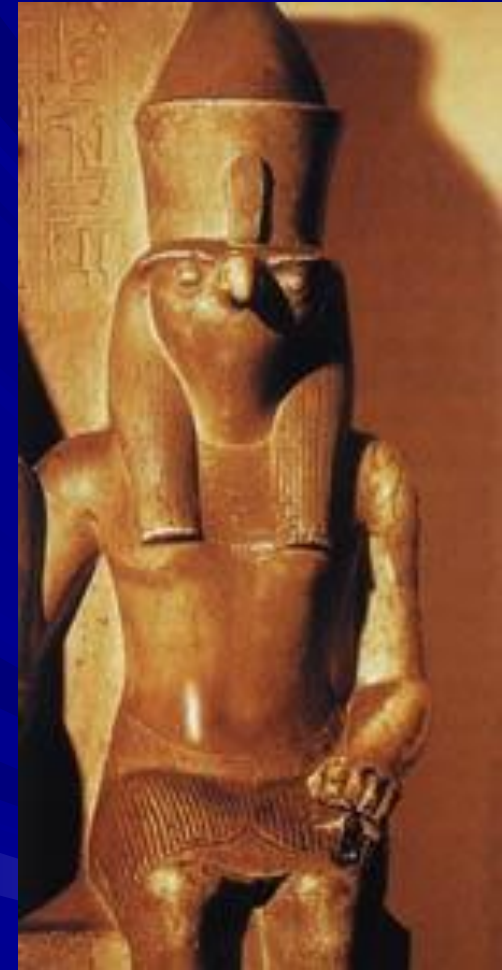
Бог Гор рельеф фрагмент 1320 г. до н. э