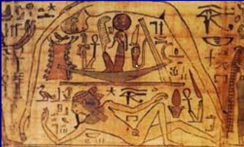
Гиб и Нут Папирус