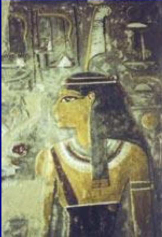
Богиня Маат Надгробие фараона Хоремхеба