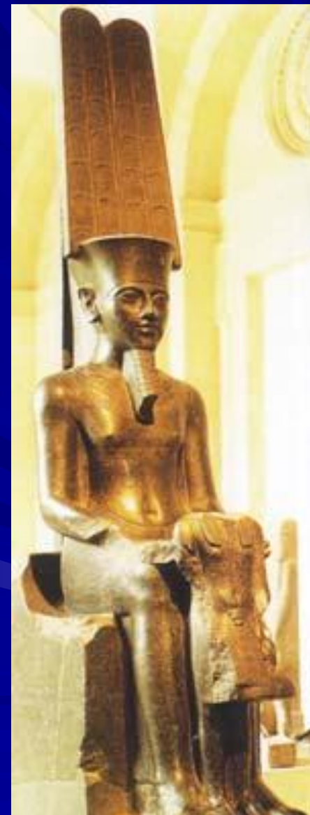
Амон Бронза 1350 г. до н.э.