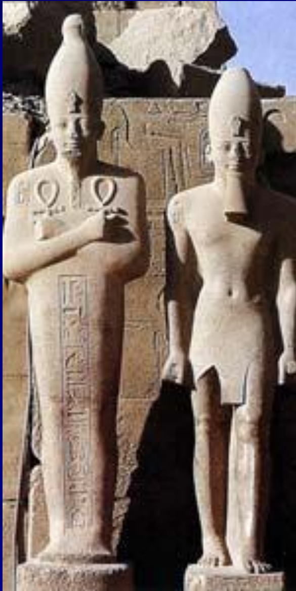
Амон – бог-творец Храм Амона-Ра в Карнаке