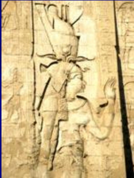
Богиня Исида Рельеф 1300г. до н.э

Исида. Греко- римская эпоха. I в. н.э. Рельеф из храма Исиды на о. Филе