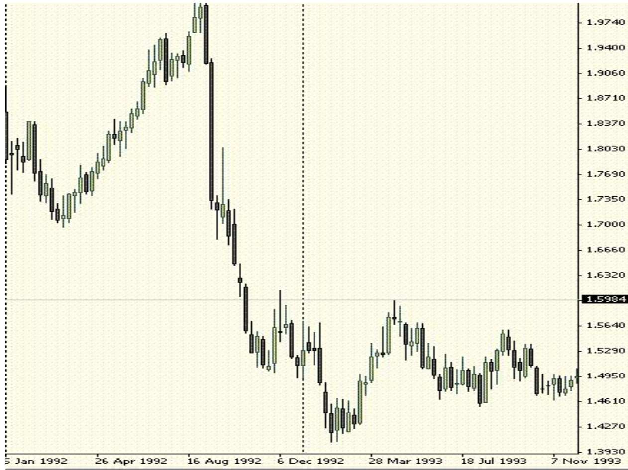
График GBP/USD, обогативший Сороса