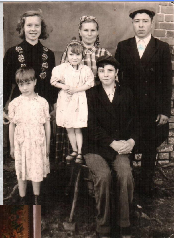
С женой и детьми