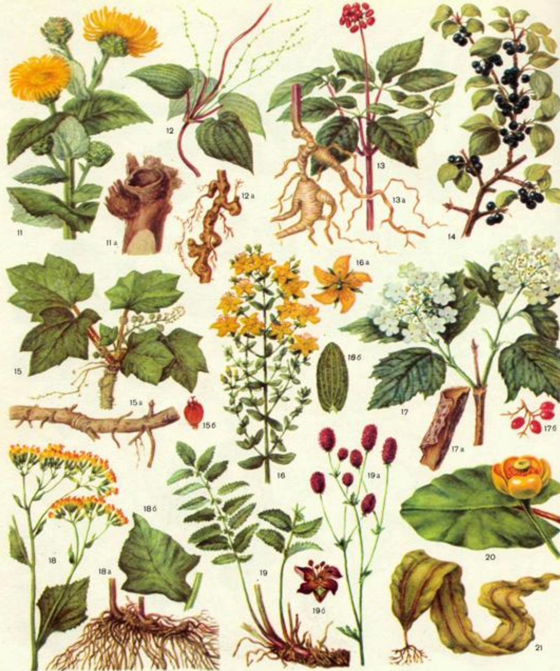
11—девясила высокий, 11а—корень; 12—диоскорея кавказская, 12а—корневище; 13—женьшень, 13а—корень; 14—жéстер слабительный; 15—заманиха высокая, 15а—корневище с корнями, 15б—плод; 16—зверобой продырявленный, 16а—цвeток, 16б—лист; 17—калина обыкновенная, 17а—кусок коры, 17б—плоды; 18—крестовник широколистный, 18а—корневище с корнями, 18б—средний стеблевой лист; 19, 19а—кровохлёбка аптечная, 19б—цвeток; 20—кубышка жёлтая; 21—ламинария японская;