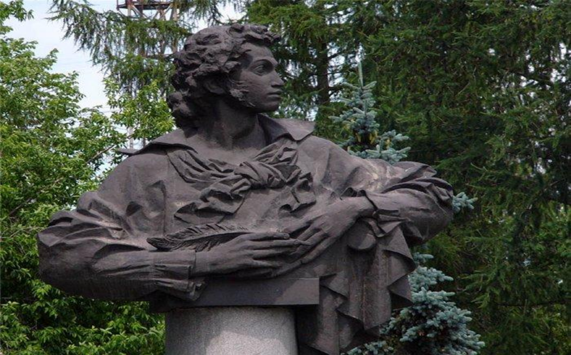
Челябинск. Парк им.Пушкина