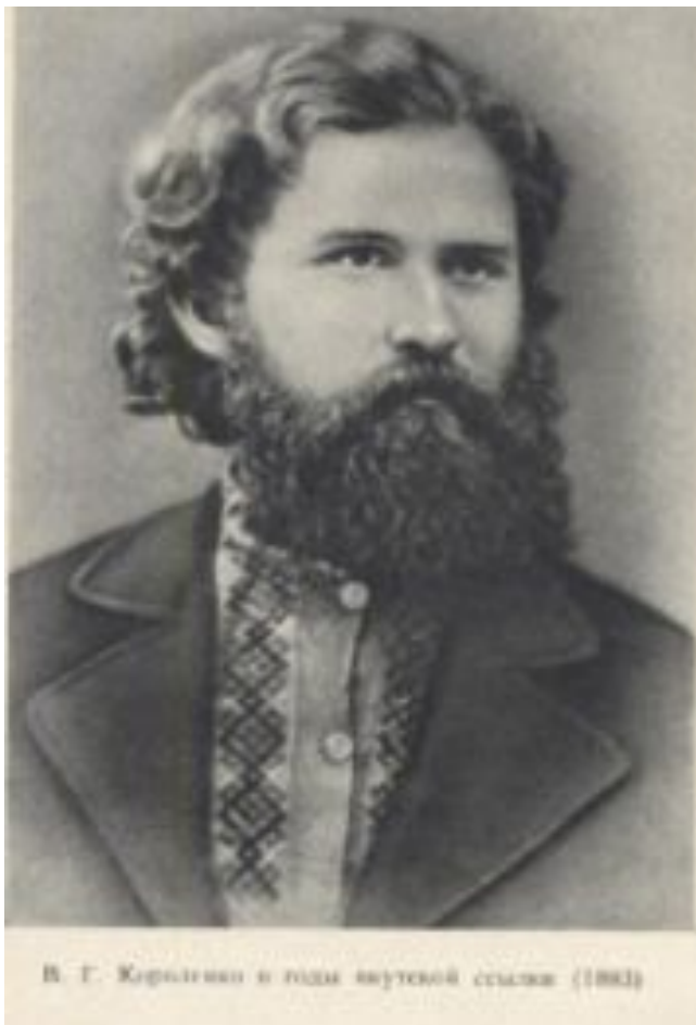
В. Г. Короленко в годы вынужденной ссылки (1882)