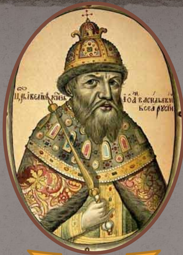
Иоанн Васильевич Грозный