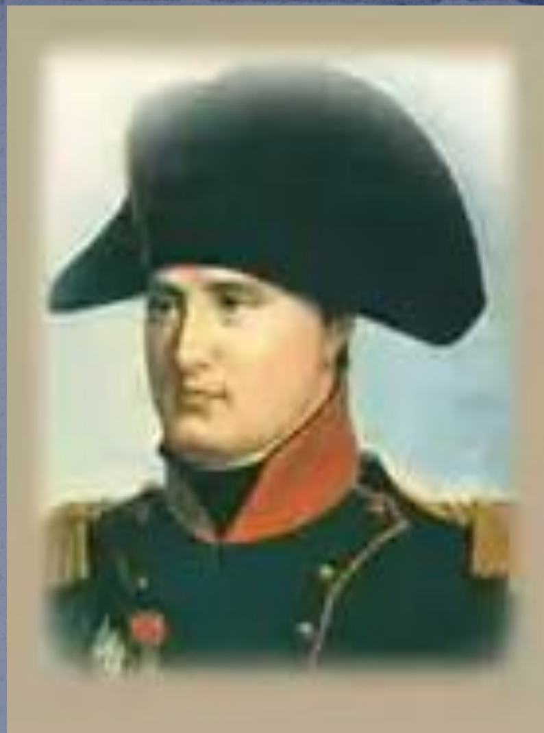
Полководец французской армии Наполеон Бонапарт.

В 1812 году французская армия под руководством Наполеона вторглась в Россию. Удар врага был так силен, что русские войска не смогли сдержать натиск противника. Началось отступление.