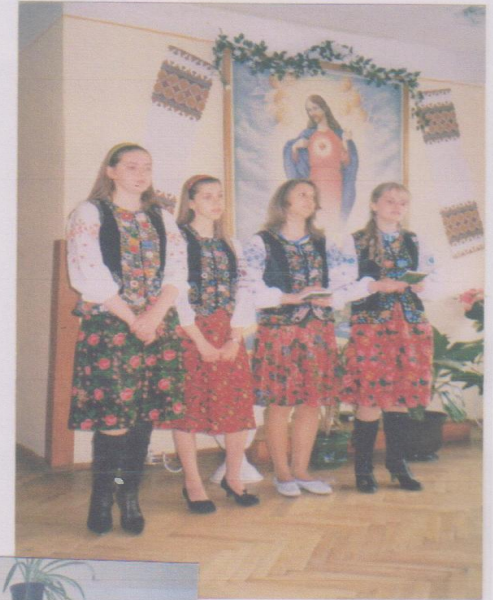
“Ніч перед Різдом”