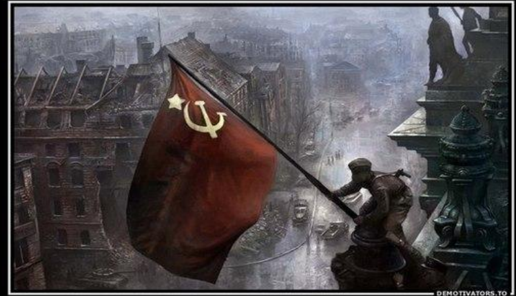
30 апреля 1945 года солдаты Красной Армии поставили флаг над рейхстагом