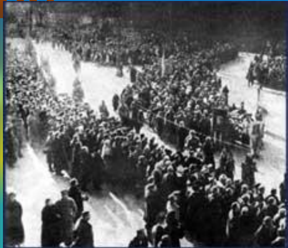
Урочисте перепоховання студентів у Києві 19 березня 1918