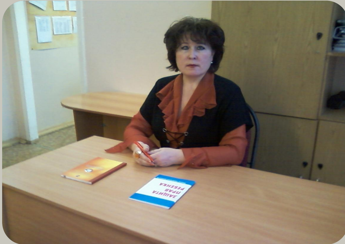
График работы: среда с 15.00-17.00 в кабинете социального педагога