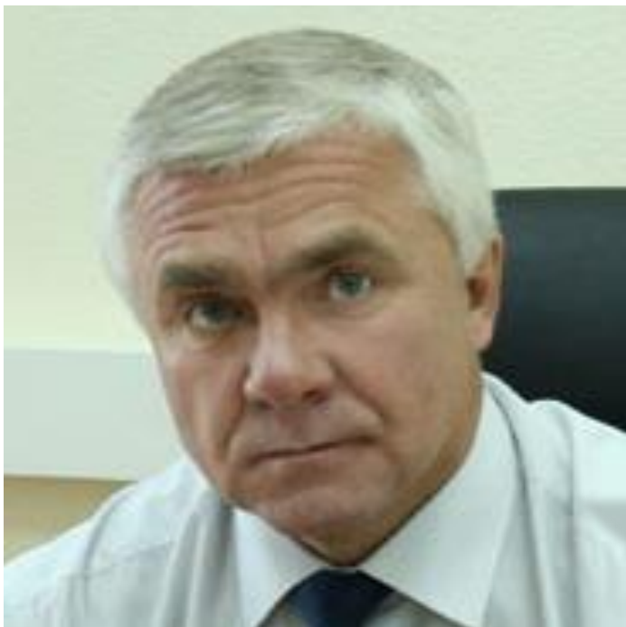
Уполномоченный по правам ребёнка Московской области Жаров Александр Евгеньевич