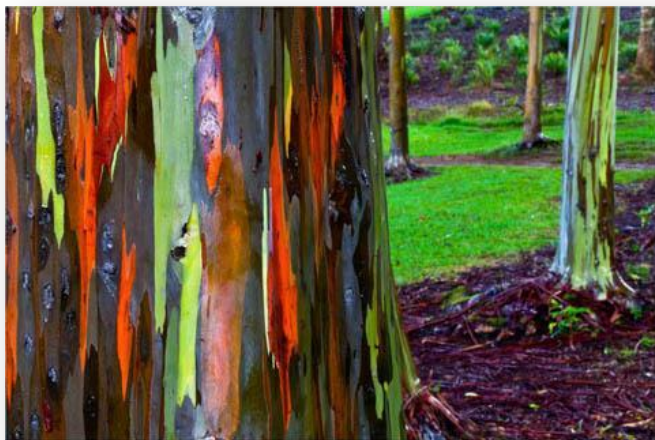
Радужный эвкалипт: абстрактные картины в австралийских лесах

Известен родственник под именем радужный эвкалипт . У этого необычного растения кора раскрашена во все цвета радуги, что делает его похожим на туземную красавицу, облаченную в пестрые праздничные наряды.