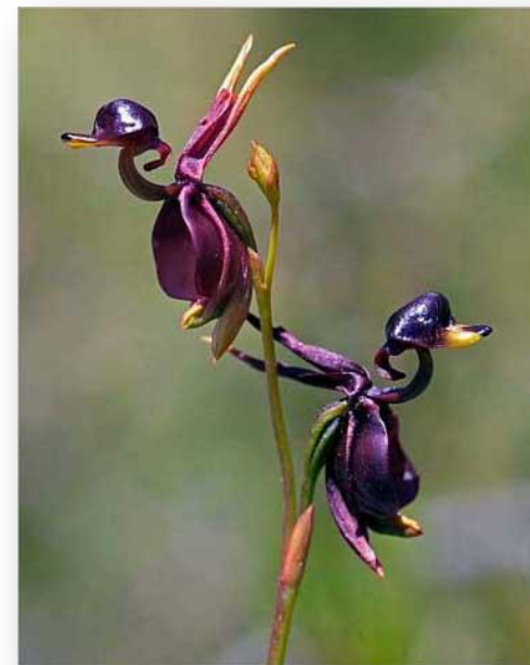
Утконосная орхидея: вся жизнь — обман

Известен родственник под именем радужный эвкалипт . У этого необычного растения кора раскрашена во все цвета радуги, что делает его похожим на туземную красавицу, облаченную в пестрые праздничные наряды.