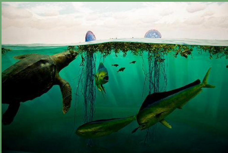
Фото из Саргассово море

Саргассово море ни на одно другое море не похоже. Его стоячие воды уже давно порождают многочисленные легенды и фантастические рассказы. Оно ограничено не континентами, а сильными атлантическими течениями.