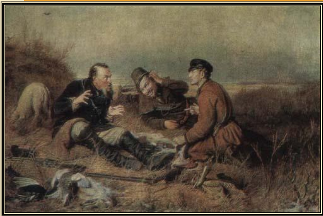
« Охотники на привале» 1870г.