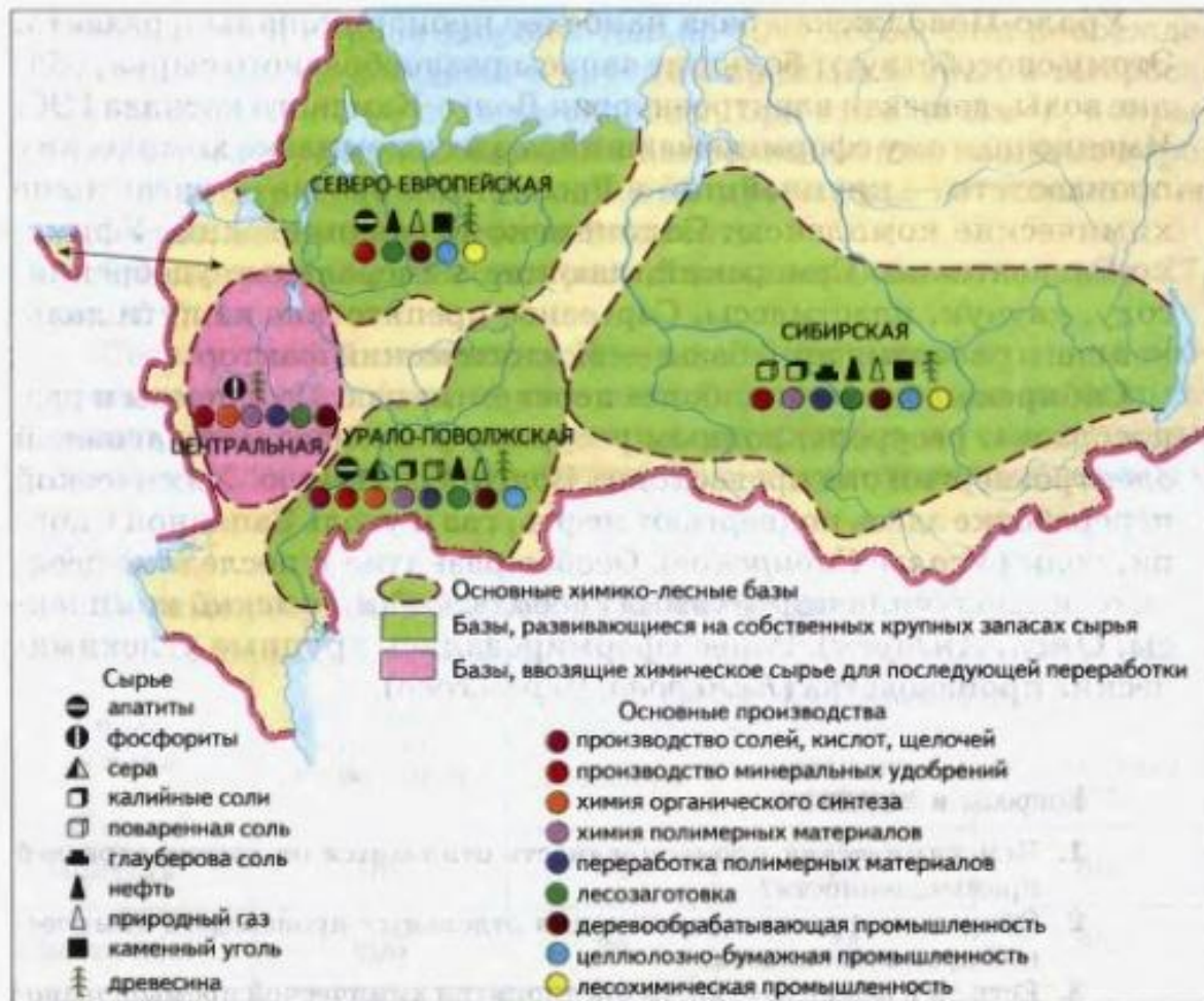
Рис. 50. География химико-лесного комплекса России